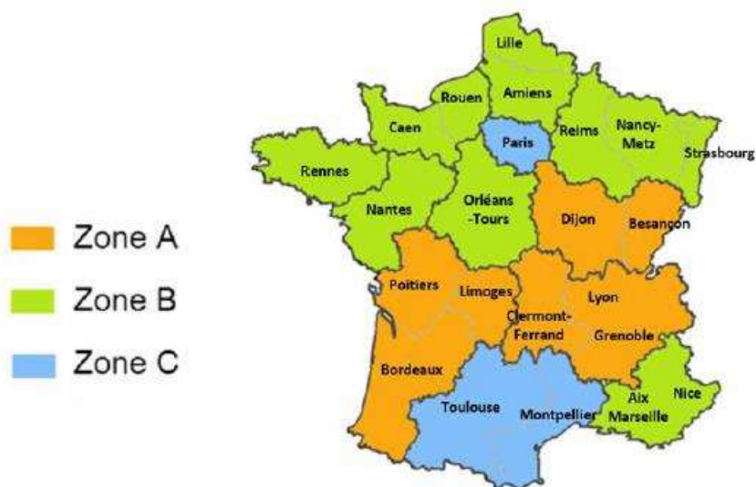
Répartition du nombre d'habitants par zone académique (en millions)